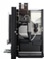
OB 2 (XL) NG